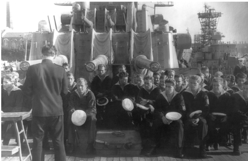
Учебные сборы курсантов на корабле БФ.

Военно-морская кафедра состояла из 3-х циклов: «Боевых средств флота», «Тактики и кораблевождения», «Электромеханического». Занятия проводились в аудиториях учебного городка № 1, учебного городка № 3 и учебного городка № 2. Командование кафедры размещалось в учебном корпусе учебного городка № 1.