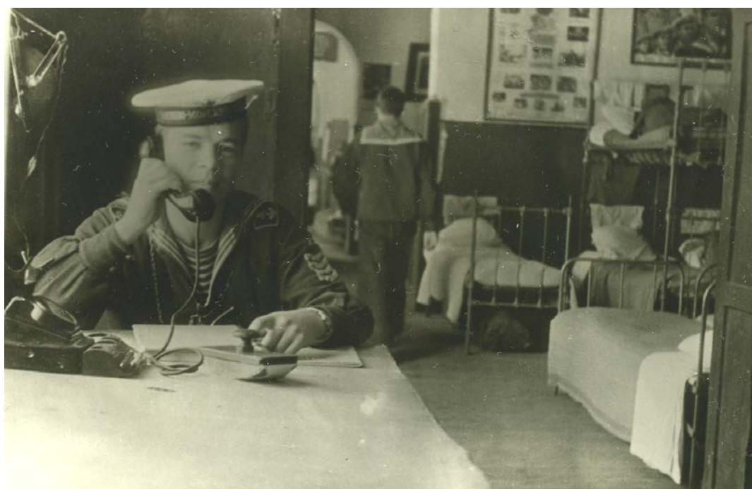
Учебная практика курсантов военно-морского факультета ЛВМУ на узле связи. Кронштадт. 1953 г.