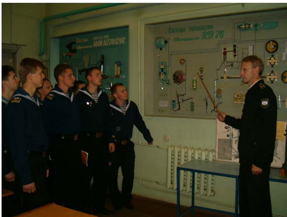
Занятие курсантов в электромеханической аудитории кафедры № 2.