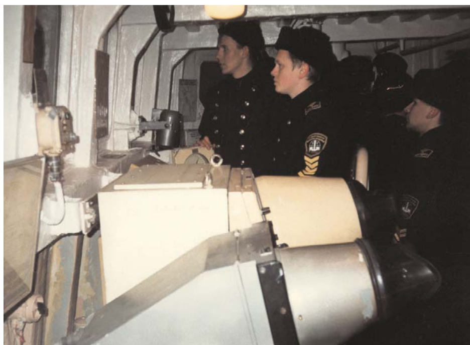
Учебные сборы курсантов на тральщике. Кронштадт.

В 1992 году в жилом корпусе УГ № 4 (п. Стрельна) началось оборудование кабинетов для проведения занятий по военно-морской подготовке с курсантами ЭМФ, АРФ, УМТ (оборудование кабинетов завершено в 1993 году).