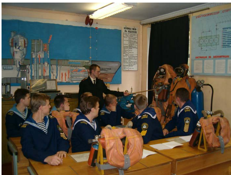
Занятие в кабинете ЛВП. 2005 г.