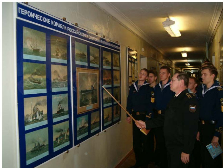
Занятие по истории военно-морского флота на факультете военного обучения. 2004 г.