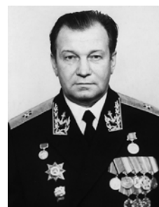
Контр-адмирал Е.Я. Бузов