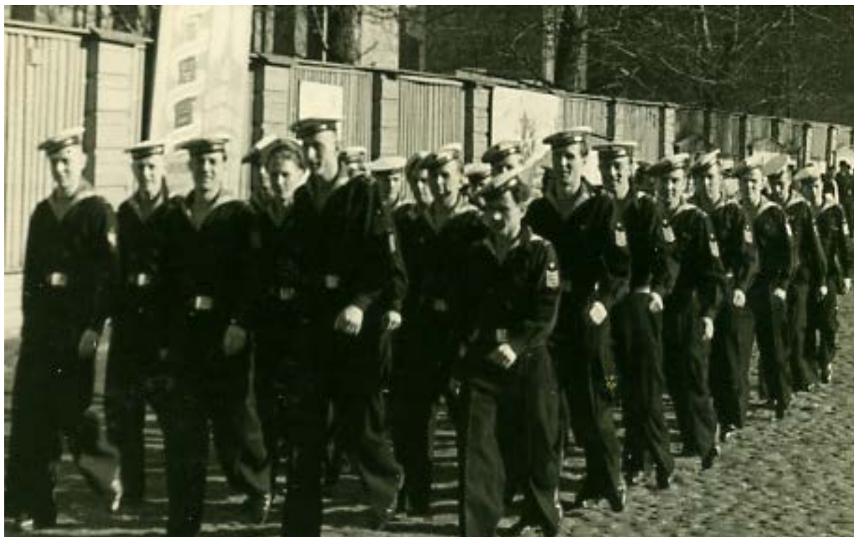
Переход строем курсантов военно-морского факультета ЛВМУ в учебный корпус.

Выпускникам факультета присваивалось воинское звание «инженер-лейтенант».