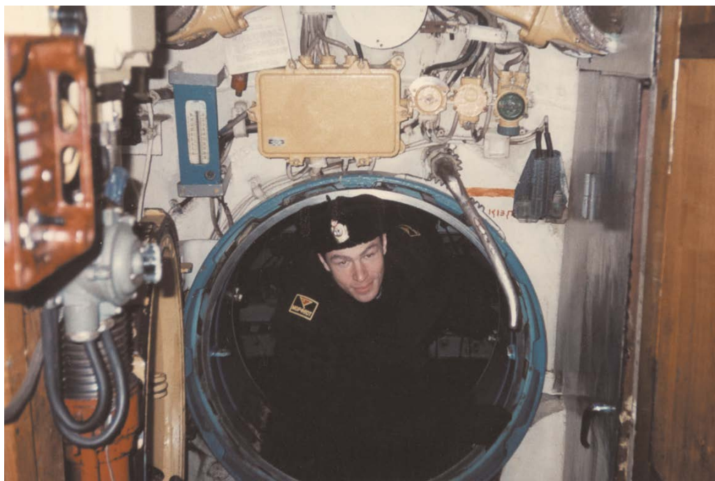
Учебные сборы курсантов на подводных лодках. Кронштадт.