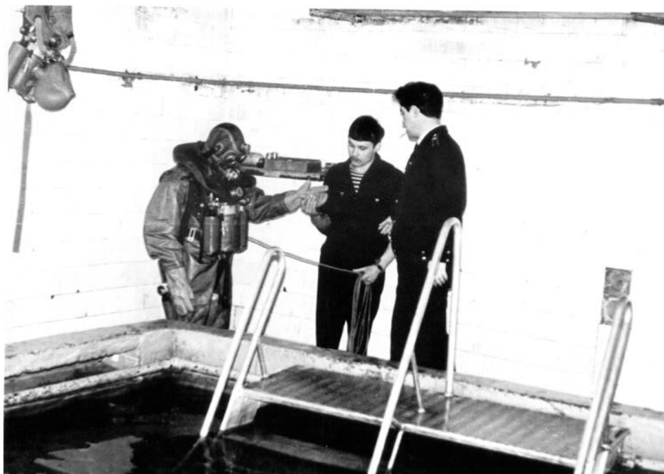
Занятие по ЛВП подготовке на военно-морской кафедре.

В 1979 году постановлением Совета Министров СССР в морских учебных заведениях введен курс военно-морской подготовки экипажей гражданских судов (ВМП ЭГС). Подготовку и чтение курса возложено на военно-морскую кафедру.