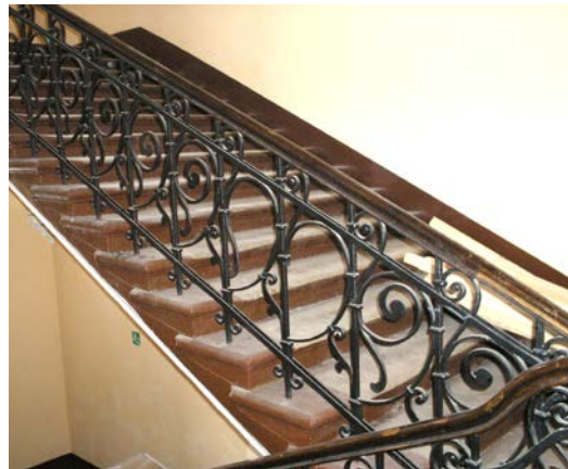
Лестница между этажами. 2010 г.

На первом этаже здания были размещены: богодельня для престарелых, спальни для них, уборные, клозеты и комнаты для пребывания. На первом этаже была размещена канцелярия.