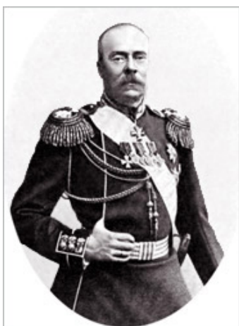
Принц А.П. Ольденбургский

В октябре 1897 г. Городская Дума постановила: «Поставить в зале Думы мраморную доску для записи на нее имен настоящих жертвователей господ Брусницыных».