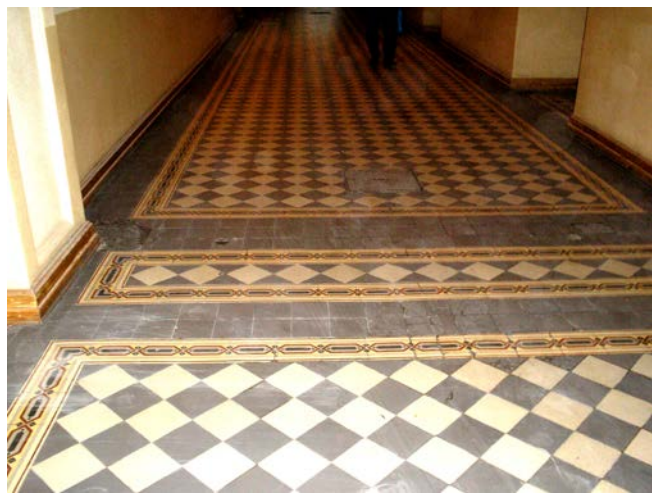
Половая плитка 1-го этажа. 2010 г.

На первом этаже здания были размещены: богодельня для престарелых, спальни для них, уборные, клозеты и комнаты для пребывания. На первом этаже была размещена канцелярия.