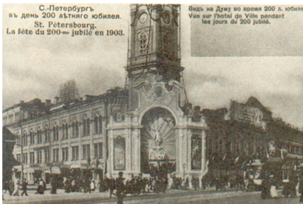
Здание Городской Думы. 1903 г.

Комплекс построек состоял из каменного 3-этажного дома, двух 4-этажных флигелей (главное здание), в которых проживало 120 престарелых рабочих и 180 сирот.