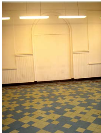
Помещение 2-го этажа. 2010 г.

3-х этажное здание было снаружи отштукатурено. Цоколь здания был из тесаной плитки. В подвале здания был плиточный пол. Внутри здания все стены были отштукатурены и окрашены клеевой краской. Местами и панели были окрашены. В рекреационном зале панели были деревянными из вагонки. Полы в коридорах, клозетах, уборных и столовой были из метлахских плиток, а в остальных помещениях полы паркетные. Каменные лестницы на железных косоурах. Окна и двери столярных работ. Отопление и вентиляция были центральными паро-водяной системы. В подвальном этаже были помещены котлы для отопления, печи для кухни, пекарня, квартиры и кладовые.