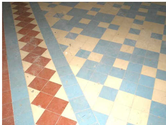
Половая плитка в помещениях 2-го этажа. 2010 г

На втором этаже были размещены помещения для пребывания мальчиков, спальни, столовая, классы, гардеробная, комнаты для воспитательниц, уборная и клозеты.