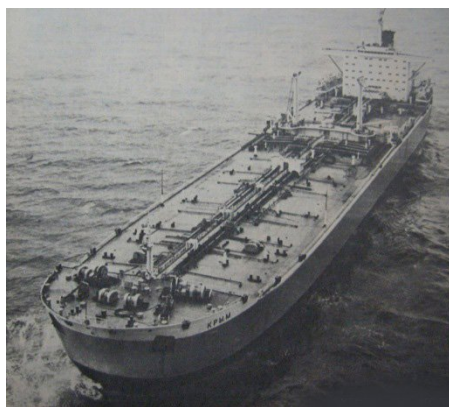
Супертанкер «Крым» 150000 тонн (1974г.)