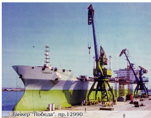
Танкер «Победа» - водоизмещением 84500 тонн (1981г.)

Далее династию продолжили мои папа и мама.