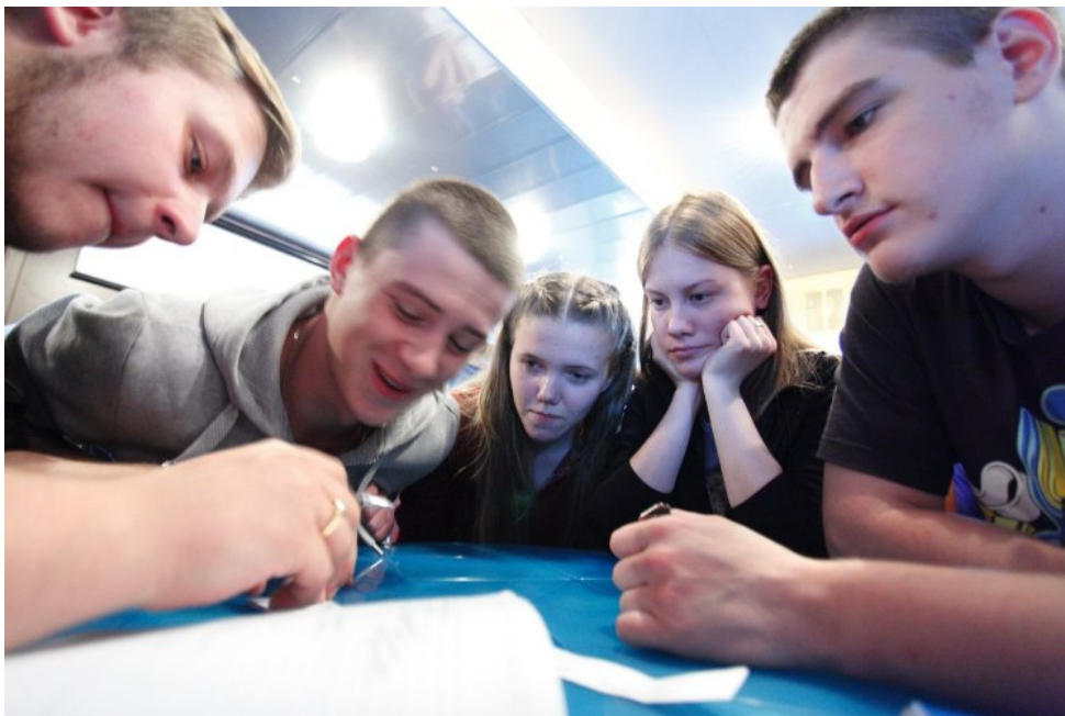
Команда интеллектуальных игр

3 место в конкурсе видео-презентаций вузов также было присуждено курсантам и студентам ГУМРФ имени адмирала С.О. Макарова.