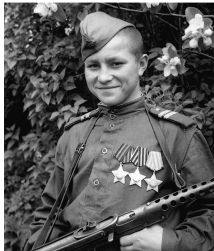
Иван Филиппович Кузнецов