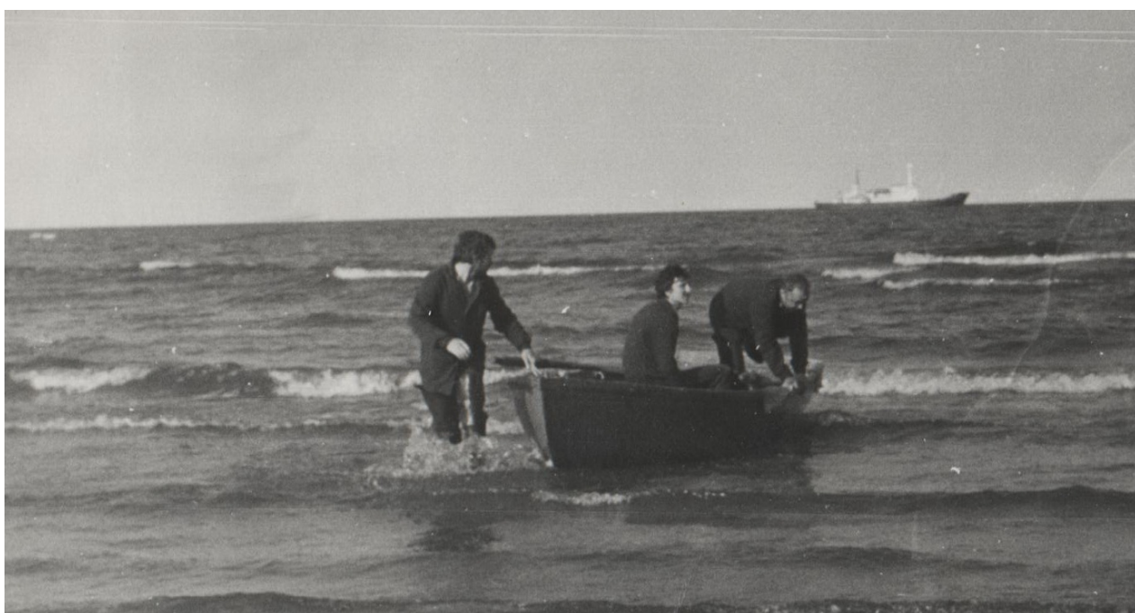
Высадка на берег гидрографической группы.

Отмелые берега Арктики создают даже при штилевой погоде в прибрежном прибое опасность для малых плавсредств.