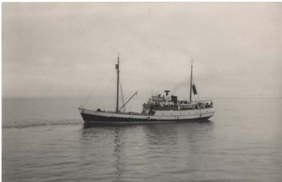
Гидрографическое судно-шхуна финской постройки. Проекты судов для лоцмейстерских работ в Арктике и гидрографических исследований.