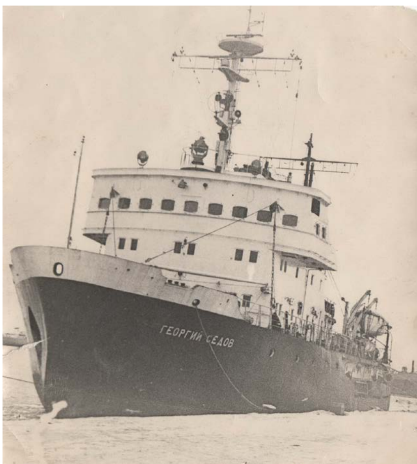
Гидрографическое судно ледокол «Георгий Седов». Первый арктический рейс в 1968 г.